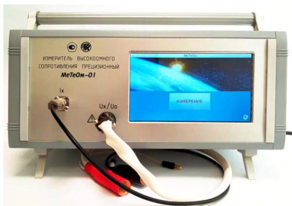
Рисунок 1 – Общий вид измерителя

Схема пломбировки от несанкционированного доступа представлена на рисунке 2.