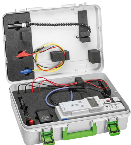
Рисунок: KSG 200 TA (с аккумулятором)