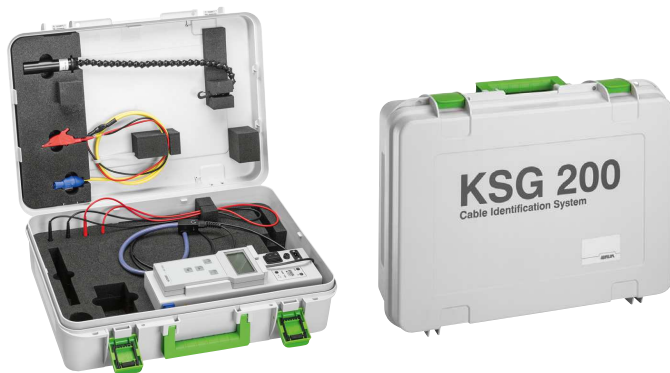
Рисунок: KSG 200 T (без аккумулятора)