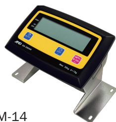
EM-14 Стойка дисплея для размещения на столе/стене