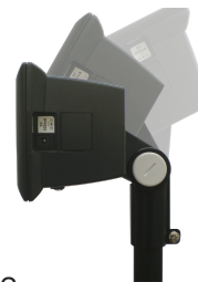
EM-12 Наклоняемое крепление индикатора