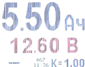
рис. 4. Дисплей прибора в режиме записи результата по команде.

В этом режиме работы прибора на дисплее не отображается номер измерения и группа (поскольку результат не был записан).