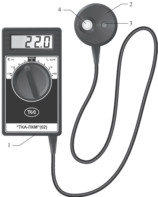
Рис.1 – Внешний вид прибора “ТКА-ПКМ”(02)