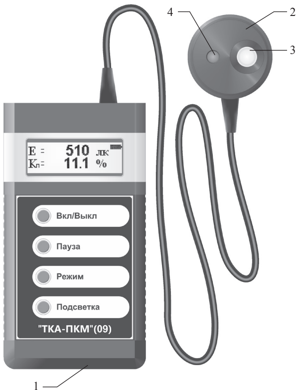
Рис.1 – Внешний вид прибора “ТКА-ПКМ”(09)