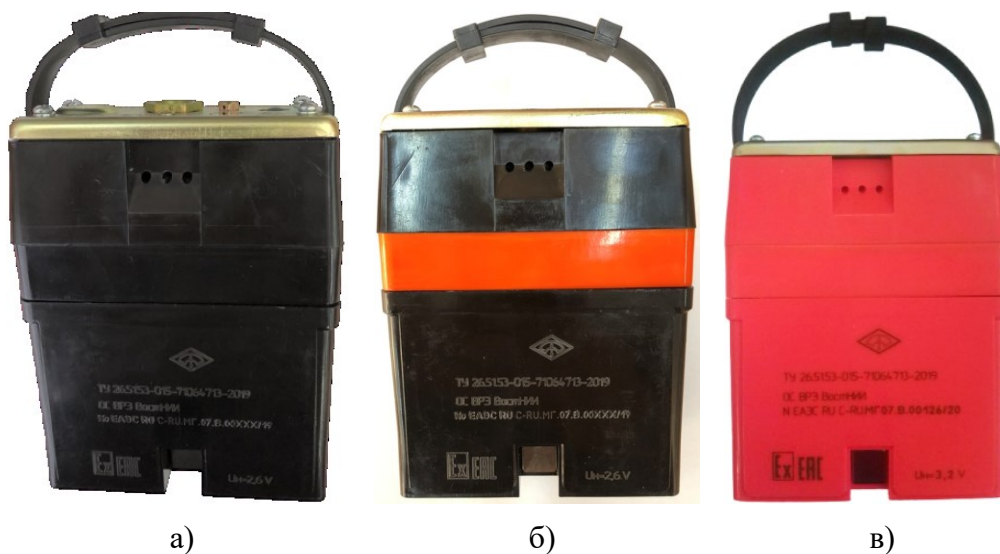
Схема пломбировки от несанкционированного доступа, обозначение мест нанесения знака поверки представлена на рисунке 3.

Общий вид дополнительного оборудования представлен на рисунке 2.