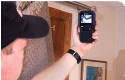
FLIR MR160: осмотр стыка стены и потолка на наличие влаги