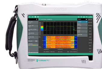
Field Master Pro MS2090A