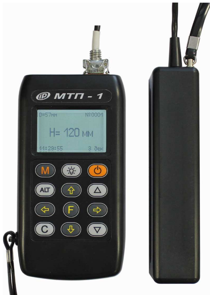
Рис. 3.1 Внешний вид прибора МТП-1

и выведен соединительный кабель. На рабочей части датчика установлены четыре элемента, имеющие сферическую поверхность для улучшения скольжения по контролируемой поверхности.