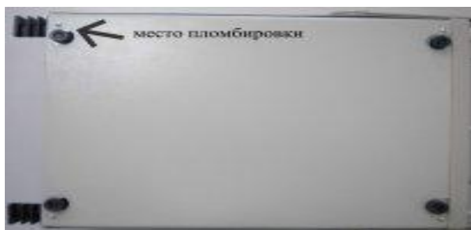
Рисунок 2 – Нижняя панель осциллографов