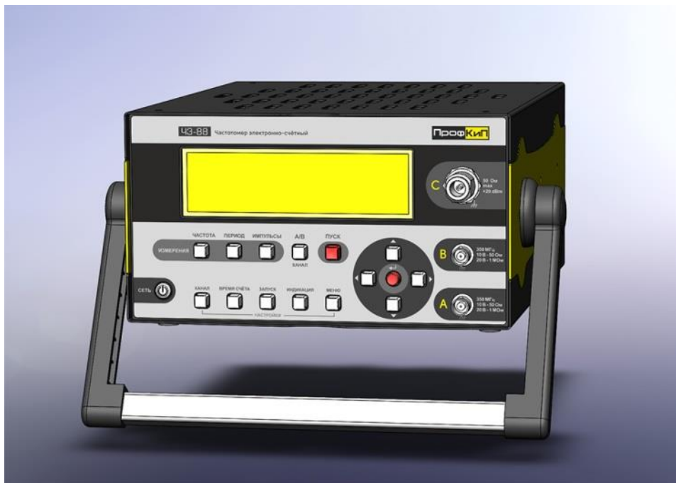
Рисунок 2 – Общий вид частотомеров универсальных ПрофКиП CZ-64, ПрофКиП CZ-88, ПрофКиП CZ-96