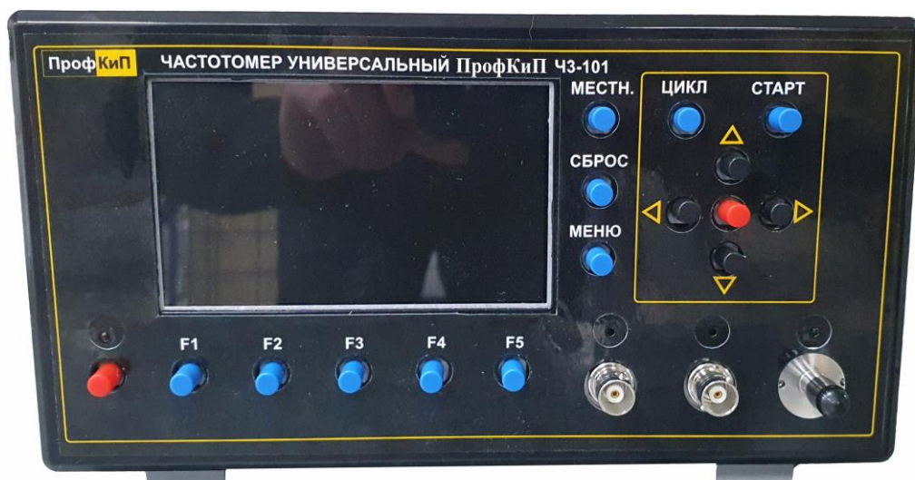
Рисунок 3 – Общий вид частотомеров универсальных ПрофКиП CZ-99, ПрофКиП CZ-100, ПрофКиП CZ-101, ПрофКиП CZ-102