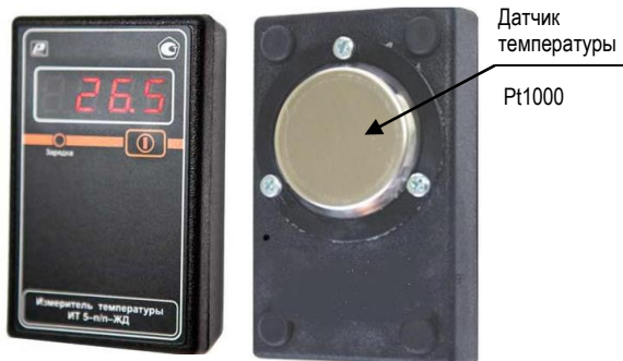
Рисунок 1 – Внешний вид измерителя температуры поверхности цифрового переносного ИТ 5–п/п–ЖД

5.2 Конструктивно измеритель представляет собой портативный прибор в пластмассовом корпусе, в соответствии с рисунком 1: