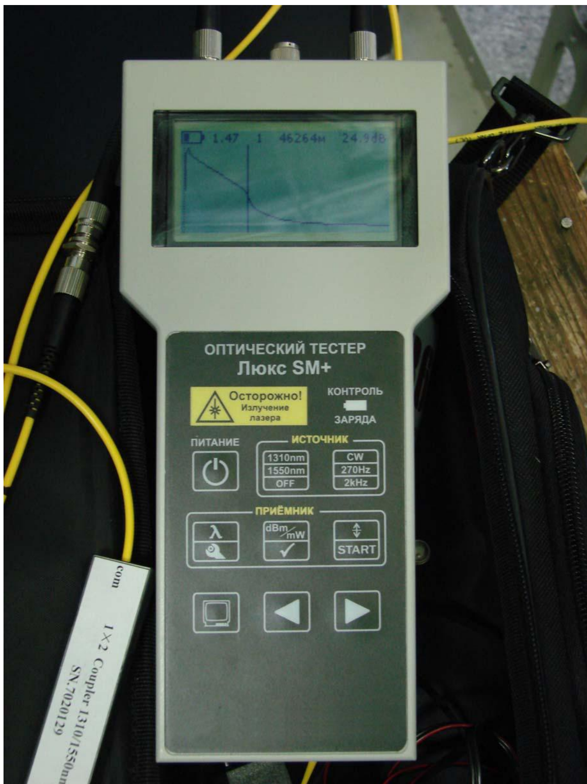
Рис. 2. Измерения на линии длиной 93 км с неисправным участком кабеля.

На линии длиной 93 км, мы не смогли увидеть отражение, т.к. она находится в неисправном состоянии. На расстоянии около 46 км от станции был потянут кабель, что хорошо видно на рефлектограмме (рис.2).