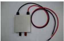
GET-001 Вынесенный выходной терминал