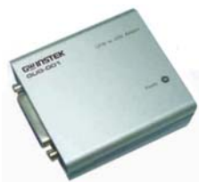
GUG-001 кабель-переходник USB/GPIB