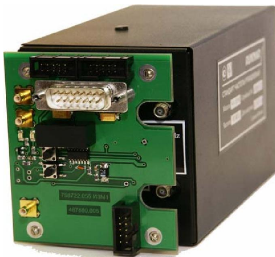
Рис.1 Внешний вид РСЧ Ч1-1014 с установленной платой приёмника РУГА.467880.005.

Внешний вид стандарта частоты рубидиевого Ч1-1014 с установленной платой приёмника РУГА.467880.005 приведен на рис.1.