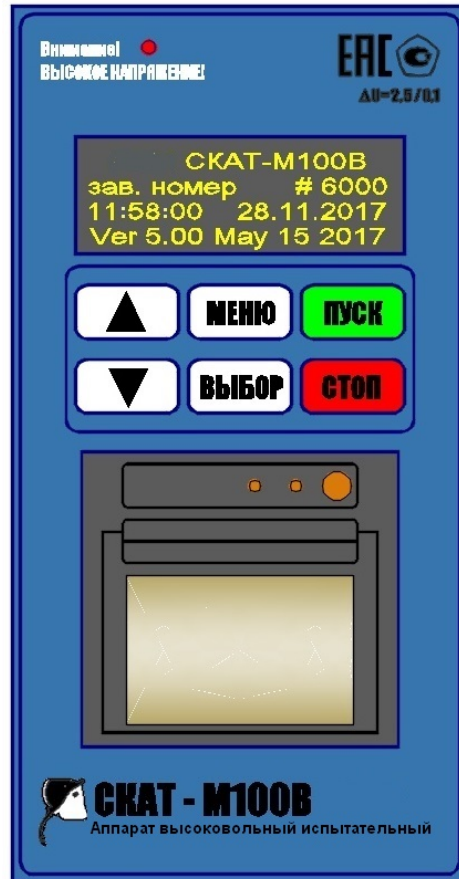
Рис.2 Передняя панель управления

3.6 При подаче высокого напряжения загорается индикатор "Внимание! ВЫСОКОЕ НАПРЯЖЕНИЕ". Все режимы аппарата, а также параметры измерения напряжения пробоя отображаются на OLED дисплее.