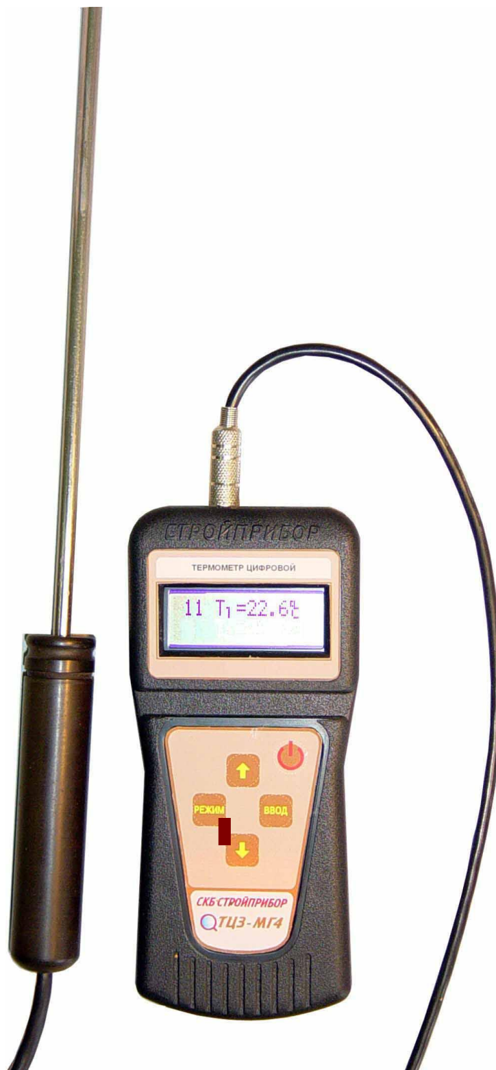
Рис.3.1. Общий вид термометра ТЦЗ-МГ4 (ТЦЗ-МГ4.01, ТЦЗ-МГ4.03)