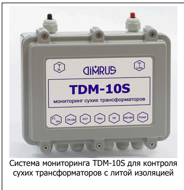
Система мониторинга TDM-10S для контроля сухих трансформаторов с литой изоляцией

Система мониторинга марки TDM-10S предназначена для оперативного контроля технического состояния силовых трансформаторов 6÷10 кВ с сухой (литой) изоляцией.