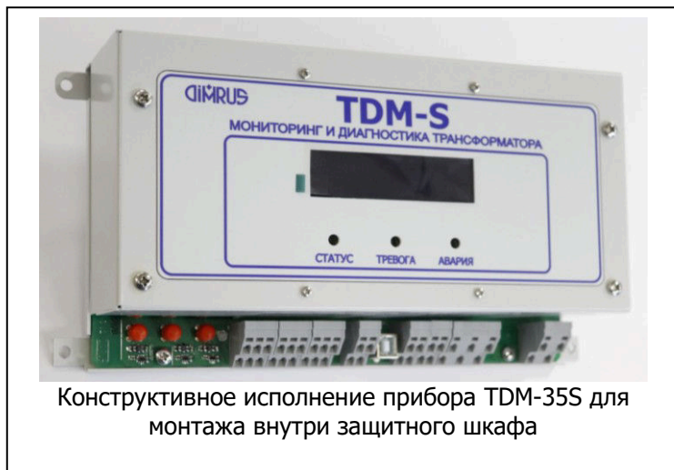
Конструктивное исполнение прибора TDM-35S для монтажа внутри защитного шкафа