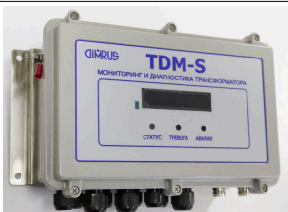
Система TDM-35S в защищенном корпусе для наружной установки рядом с трансформатором