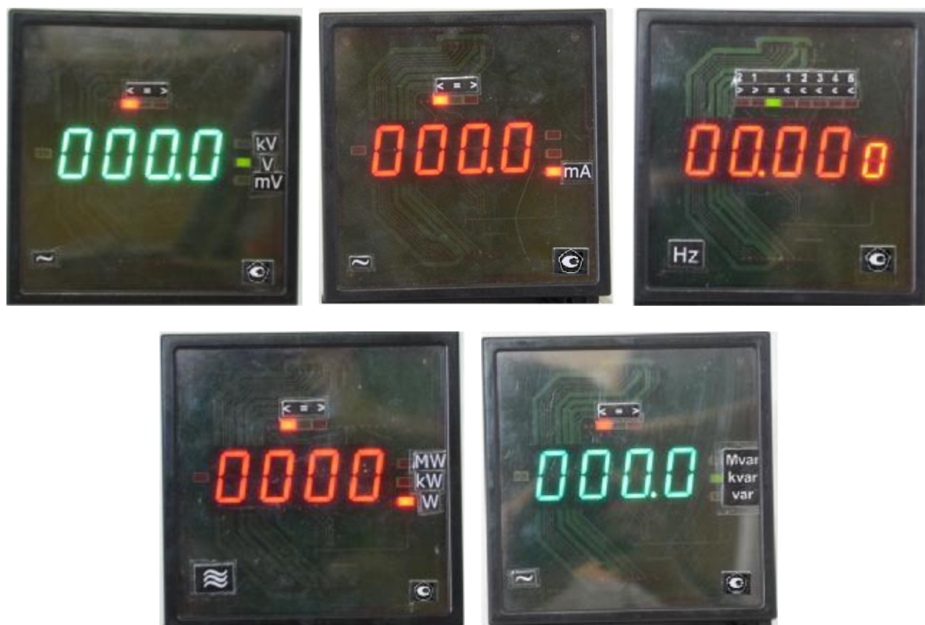
Рисунок 2 – Общий вид приборов в корпусе типоразмера 2