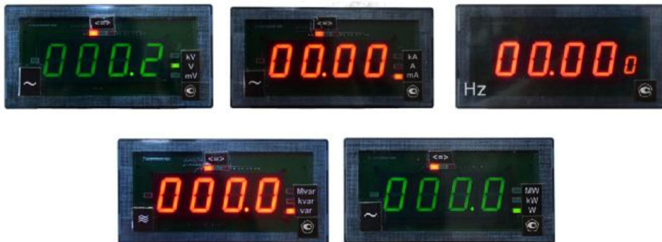
Рисунок 1 – Общий вид приборов в корпусе типоразмера 1